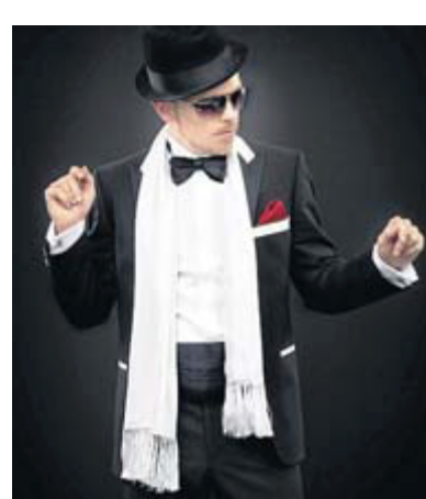
Beaten zusammen mehr: Jan Delay

Alte oder aktuelle Feindseligkeiten, Auseinandersetzungen und Dissen sollen an den beiden Abenden draußen bleiben. Mal sehen, ob alle Sänger und Rapper den Rauch der Friedenspfeife inhalieren. Um das Gemeinschaftsgefühl zu verstärken, nehmen die Fans die Musiker in ihre