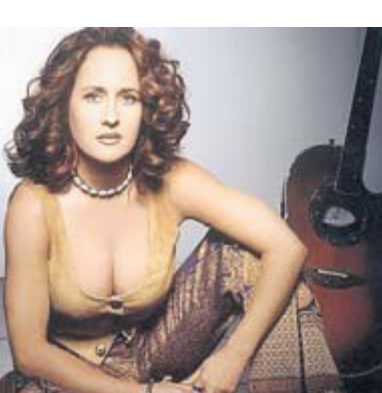
Wurde mit Hits wie „Square Biz“ und „Lovergirl“ bekannt: Teena Marie starb mit 54 Jahren.