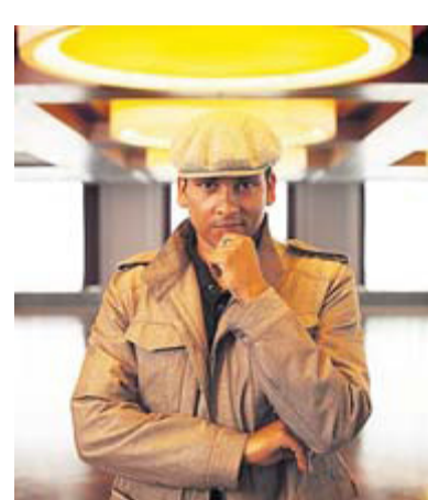
...und Xavier Naidoo.

Live: Freitag, 7. Januar, 18 Uhr, O2 World, Hamburg und Samstag, 8. Januar, 20 Uhr, O2 World, Berlin.