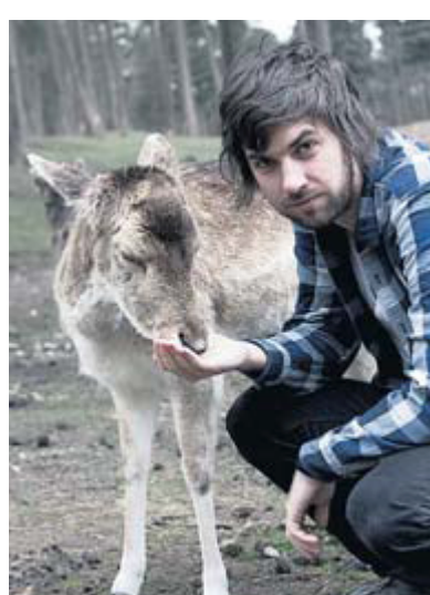
Aufgewachsen im Naturpark: Liedermacher Gregor McEwan.